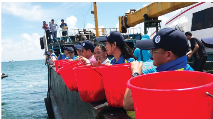
兩地代表前往香洲近岸海域進行漁業資源增殖放流活動 Deslocação dos representantes de duas partes à costa de “Heong Chou” para colocar alevinos visando desenvolver a piscicultura

為響應6月8日世界海洋日，澳門海事及水務局與珠海市海洋農業和水務局於當日合辦“2017年世界海洋日暨全國海洋宣傳日活動”，以提高珠澳兩地各界人士保護海洋、愛護海洋的意識，同時藉此推動珠澳海洋事務合作。出席代表並集體簽署了“愛我藍色海洋，護我碧海銀灘”倡議書，提倡共同宣傳海洋生態保護理念，推動珠澳兩地各界人士保護海洋環境和生態資源。