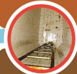
污垢積聚細菌滋生