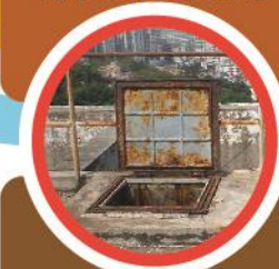
昆蟲、動物、污物進入