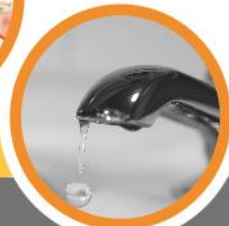
水壓不足、過大或供水中斷