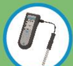
餘氯及酸鹼度檢測儀